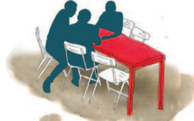
Abbildungen: bgmr Landschaftsarchitekten