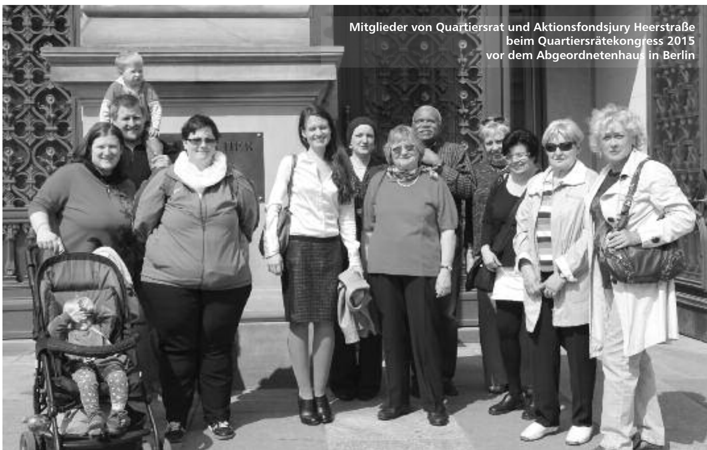
Mitglieder von Quartiersrat und Aktionsfondsjury Heerstraße beim Quartiersrätekongress 2015 vor dem Abgeordnetenhaus in Berlin