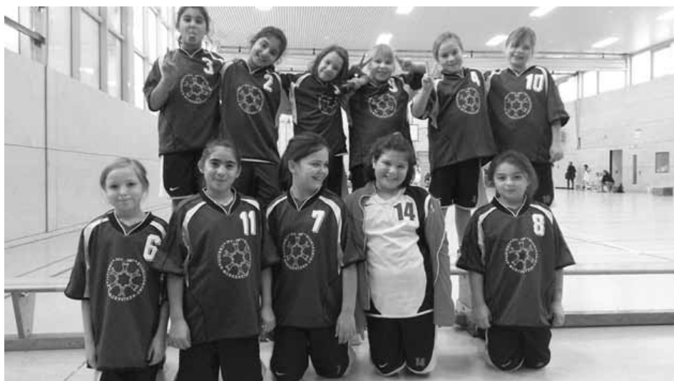
Große Begeisterung bei den Teams der Christian-Morgenstern-Grundschule

Das Bewegungs-, Sport- und Basketballprojekt mit ALBA und