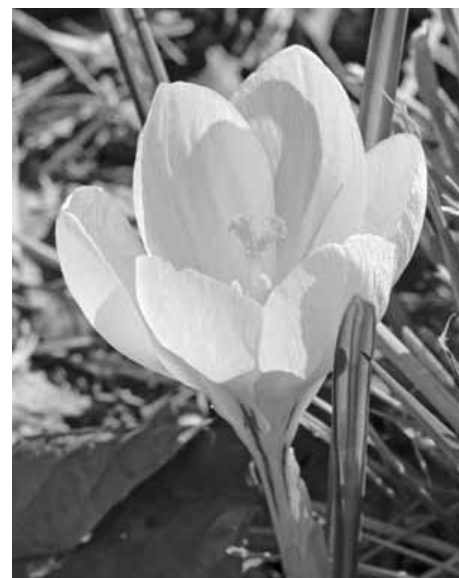
Etwas Neues entsteht: Die Flaniermeile wird immer schöner.