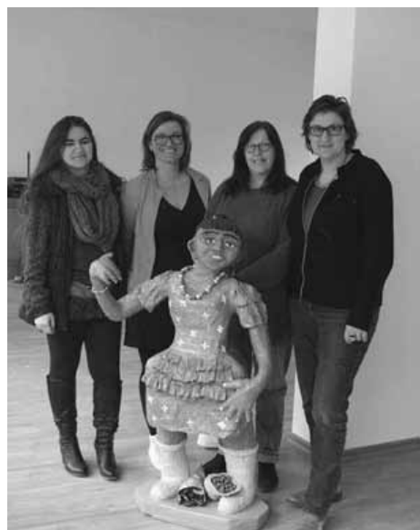
Die Fünf vom neuen Frauentreff

Besonders aber auch, wenn es um die eigene zukünftige berufliche (Neu)Orientierung geht. Ob Wege zurück in das Arbeitsleben nach „Kinder- und Erziehungszeit“ oder Ausbildung trotz Baby für jugendliche oder junge Mütter, das erfahrene Team vom „Kiosk_aller.Hand.Arbeit“ kennt kaum einen Bereich, der Frauen und Mütter bewegt, zu dem sie nicht auch Ratgeberinnen finden können.