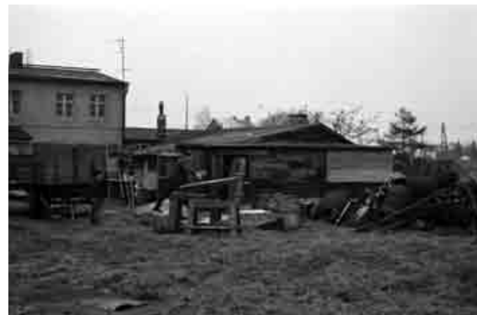
Die Häuser der Lazarus-Siedlung, einst für die Gutsarbeiter errichtet, müssen der Obstalleesiedlung weichen.

um den Meydenbauerweg, überwiegend errichtet von der Hilfswerksiedlung, der gemeinnützigen Wohnungsbaugesellschaft der evangelischen Kirche, sowie mit dem Einkaufszentrum und dem 12-geschossigen Laubenganghaus der GSW Sand-/Heerstraße. Dem folgte ab 1967 auf der Nordseite der Heerstraße und westlich des Magistratsweges die Wissell-Siedlung der BeWoGe, mit den Erschließungsstraßen Pillnitzer- und Loschwitzer Weg, mit kleinem Einkaufs- und Gemeindezentrum sowie Kita innerhalb des Erschließungsringes.