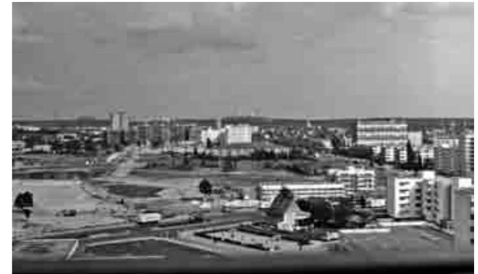
Blick aus dem noch im Bau befindlichen Tor-Hochhaus am Loschwitzer Weg. Im Hintergrund sieht man schon die Bautätigkeiten am Blasewitzer Ring. Von Obstallee und Staaken-Center ist noch nichts zu sehen.

Unsere heutige Großsiedlung in Staaken wurde in vier zeitlich und räumlich voneinander getrennten Abschnitten von mehreren Bauherren auf sogenannten Baulandreserven von landwirtschaftlichen Flächen und Gartenland errichtet. Begonnen hat es Anfang der sechziger südlich der Heerstraße zwischen Sandstraße und Gruberzeile, rund