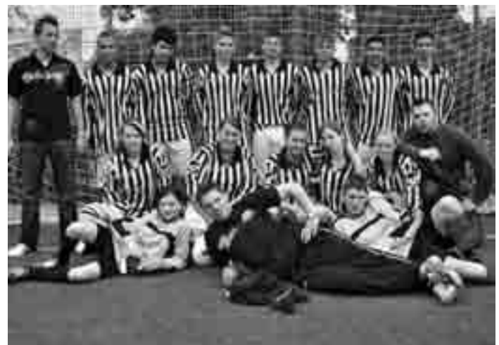
Toller Auftritt von Berlin bolzt in München

Kontakt zur Bolzplatzliga unter www.berlin-bolzt.de .