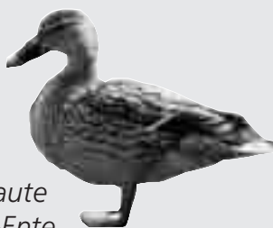
Hilda, unsere vorlaute Redaktions-Ente meint: