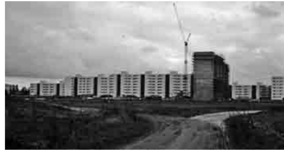
Noch im Bau, Blick vom Magistratsweg auf den Loschwitzer Weg. Die aufsteigenden Gebäuderiegel parallel zur Heerstraße und Loschwitzer Weg stammen aus der Feder des Schülers von Hans Scharoun und ehemaligen Senatsbaudirektors Werner Düttmann, der maßgeblich an der Interbau im Hansaviertel beteiligt war.

Westdeutschland angeworbenen jungen Arbeitnehmer sowie für die „Gastarbeiter“ und ihre Familien benötigte man dringend Wohnraum. Dazu kam die untragbare Wohnsituation vor allem in den Hinterhöfen der alten Arbeiterviertel, die Ersatzwohnungen für eine Entkernung