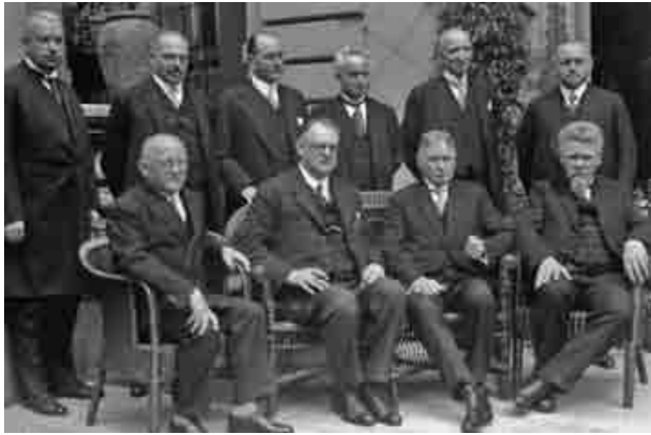
Der Arbeitsminister Rudolf Wissell (sitzend rechts) und das II. Kabinett Müller 1928-1930

1969 wurde für einen Teil der heutigen Großsiedlung Heerstraße feierlich der Name Rudolf-Wissell-Siedlung verliehen. Für DAF e.V. Anlass genug, um mit Unterstützung der Immobilienverwaltung Alt & Kelber sowie des Quartiersmanagements Heerstraße am 16. Oktober 2009 ab 14.00 Uhr auf dem Platz am Loschwitzer Weg ein Fest zu veranstalten und gemeinsam mit allen Nachbarn den 40. Jahrestag der Namensgebung zu feiern.