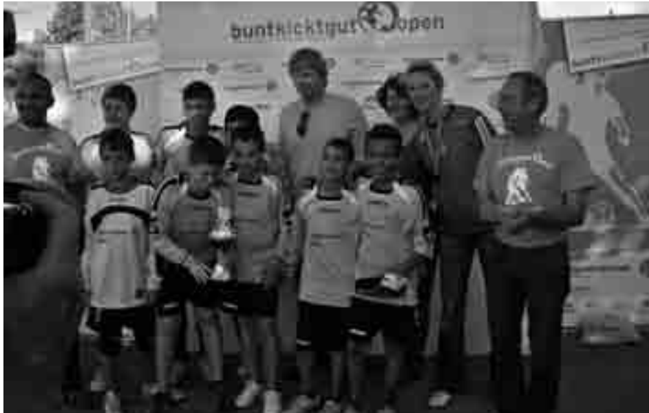
Mit dem Titan Olli Kahn auf dem Podest

Wir schreiben das Jahr 2009, 19. Juli, 17:10 Uhr Ortszeit auf dem Trainingsgelände des FC Bayern München, Säbener Straße. Der Titan, Oliver Kahn, überreicht den Spandauer Allstars aus der Bolzplatzliga hochverdiente Preise bei den Bunkicktgut-Open.