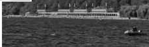
Impressionen einer Dampferfahrt

zwar gering, aber der Spaß mit Celine und die Hilfe, die ich der Mutter dadurch biete, entschädigen für die aufgewandte Zeit.