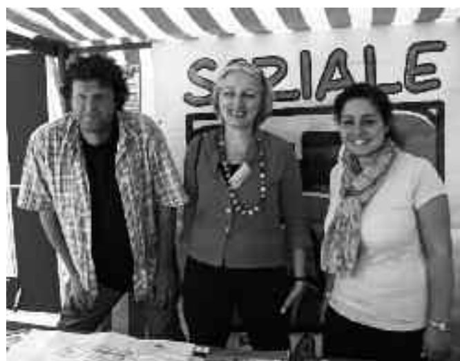
Fast das ganze QM-Team beim Stadtteilfest

Nutzen Sie die vielen schönen Angebote in den Einrichtungen im Stadtteil und machen Sie mit.