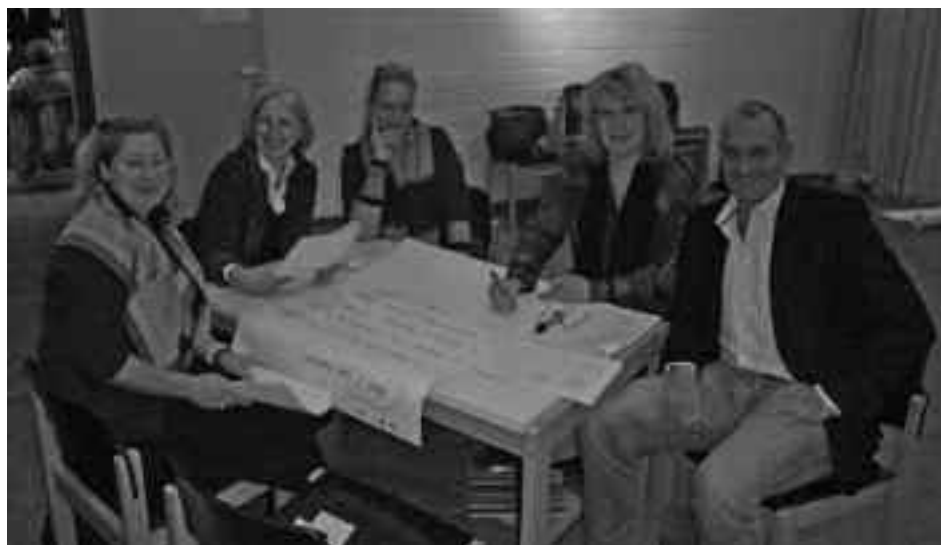
Bei der Auftaktveranstaltung zum Projekt „Bildungsnetz Heerstraße Nord“