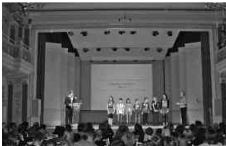
„Stern des Sports“ für Menschen in Bewegung.

Chancen auf dem Arbeitsmarkt“, „Besseres Gesundheitsniveau“, „Steigerung des Sicherheitsempfindens“ als wichtige Ansätze für eine Stabilisierung des Gemeinwesens anerkannt werden. „Soziale und