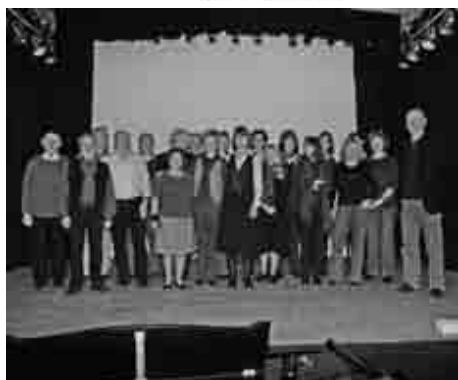
Chor Teacher's Voices erstmalig im Kulturzentrum Gemischtes

Diesmal möchte der Chor mit den Spenden die Arbeit des Kulturzentrums Gemischtes unterstützen.