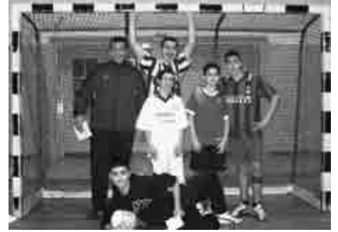
Endlich wieder bolzen...