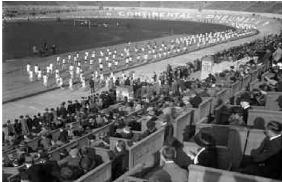
Deutsches Stadion mit Radrennbahn 1923...

Im Jahr 1906/07 pachtete der führende Verein für Pferdesport, der Union Club, ein Waldgelände im aufstrebenden Westend. Gut angebunden über Heerstraße und Kaiserdamm, mit Vorortbahn und U-Bahnplanung war es optimal, um dort die Rennbahn Grunewald zu errichten, mit Galopp- und Hindernisbahn, Tribünen, Stallungen und Restaurant. Direkt hinter der Ziellinie gab es den Pavillon für die kaiserliche Familie. Zur Eröffnung im Mai 1909, natürlich mit Kaiserpaar, konnte auch der Bahnhof Rennbahn in Betrieb genommen werden.