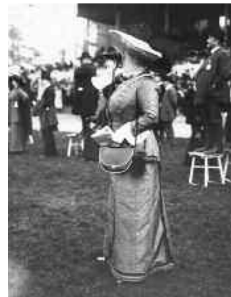
Eine mondäne Besucherin der Rennbahn 1912

Parallel wurde an gleicher Stelle der Bau eines Sportstadions und Schwimmbades für die Olympischen Spiele 1916 in Angriff genommen. Das Stadion wurde inmitten der Rennbahn in eine riesige Grube abgesenkt und war nur durch einen Tunnel zugänglich. Schließlich sollte die Sicht auf die Pferderennen nicht beeinträchtigt werden. Das Deutsche Stadion, wie auch der dazugehörige U-Bahnhof, wurden im Juni 1913 eröffnet. Der I. Weltkrieg verhinderte jedoch die Olympischen Spiele 1916.