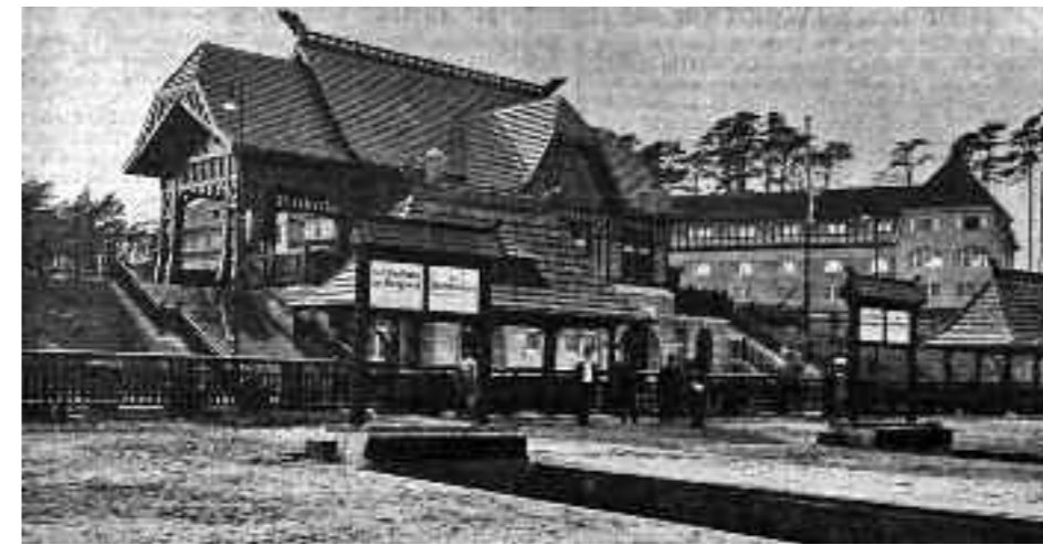
Bahnhof Rennbahn 1909 (Zentralbl. der Bauverw. Jg. 1913);