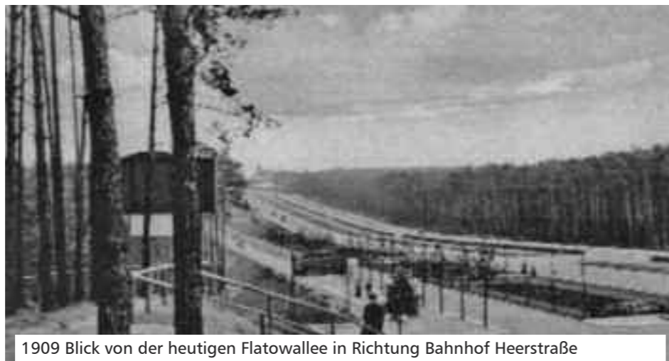
1909 Blick von der heutigen Flatowallee in Richtung Bahnhof Heerstraße

zur Erschließung vom damaligen Nobelvorort Westend, von Trabrennbahn, Galopprennbahn, Stadion und anderen attraktiven Ausflugszielen zwischen Charlottenburg und Pichelswerder werden auch die politischen und wirtschaftlichen Hintergründe und Interessen in der rasant wachsenden Hauptstadtregion des jungen Kaiserreiches gespiegelt.